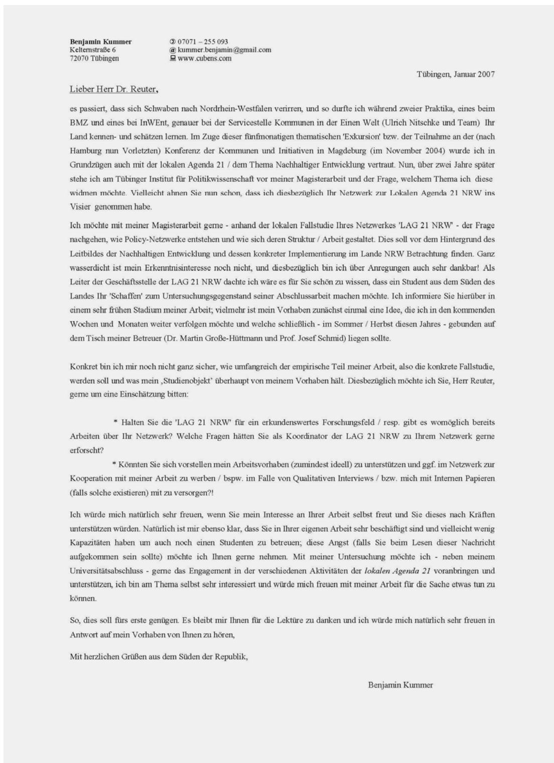
Abbildung 14: Anschreiben zum Erstkontakt